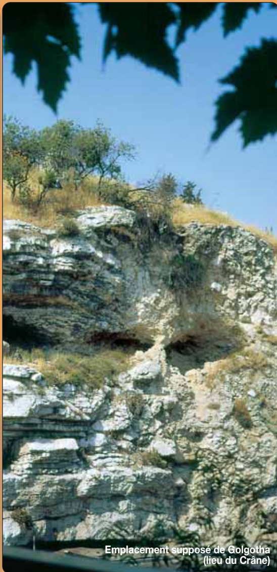
Emplacement supposé de Golgotha (lieu du Crâne)