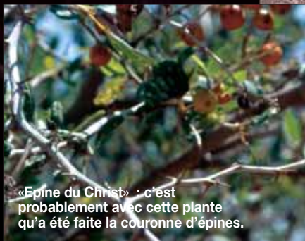
« Épine du Christ » : c'est probablement avec cette plante qu'a été faite la couronne d'épines.