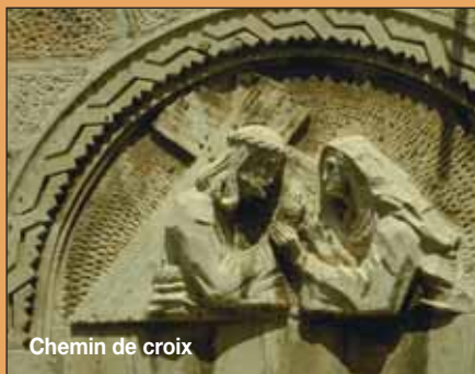
Chemin de croix

Soudain la nuit tombe en plein midi. Un calme inquiétant enveloppe la scène. Suivent trois heures interminables dans une obscurité totale. Vers 3 heures de l'après-midi une prière déchirante s'élève de la croix : « Mon Dieu, mon Dieu, pourquoi m'as-tu abandonné ? »