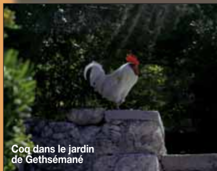
Cog dans le jardin de Gethsémané