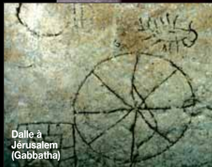
Dalle à Jérusalem (Gabbatha)