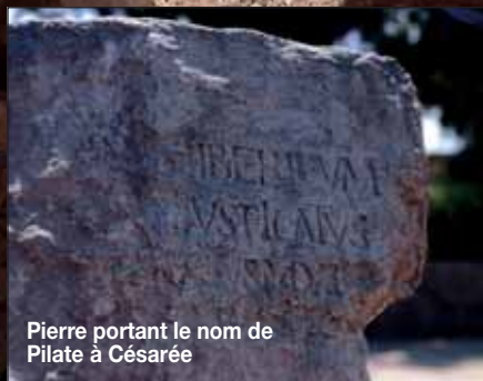
Pierre portant le nom de Pilate à Césarée

Jésus répond : « Tu le dis que moi je suis roi. Moi je suis né et je suis venu dans le monde, pour rendre témoignage à la vérité. Quiconque est de la vérité écoute ma voix. » (Jean 18. 37)