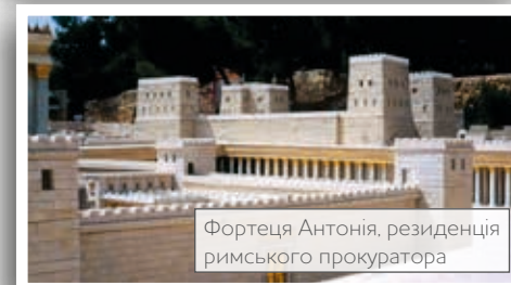
Фортеця Антонія, резиденція римського прокуратора