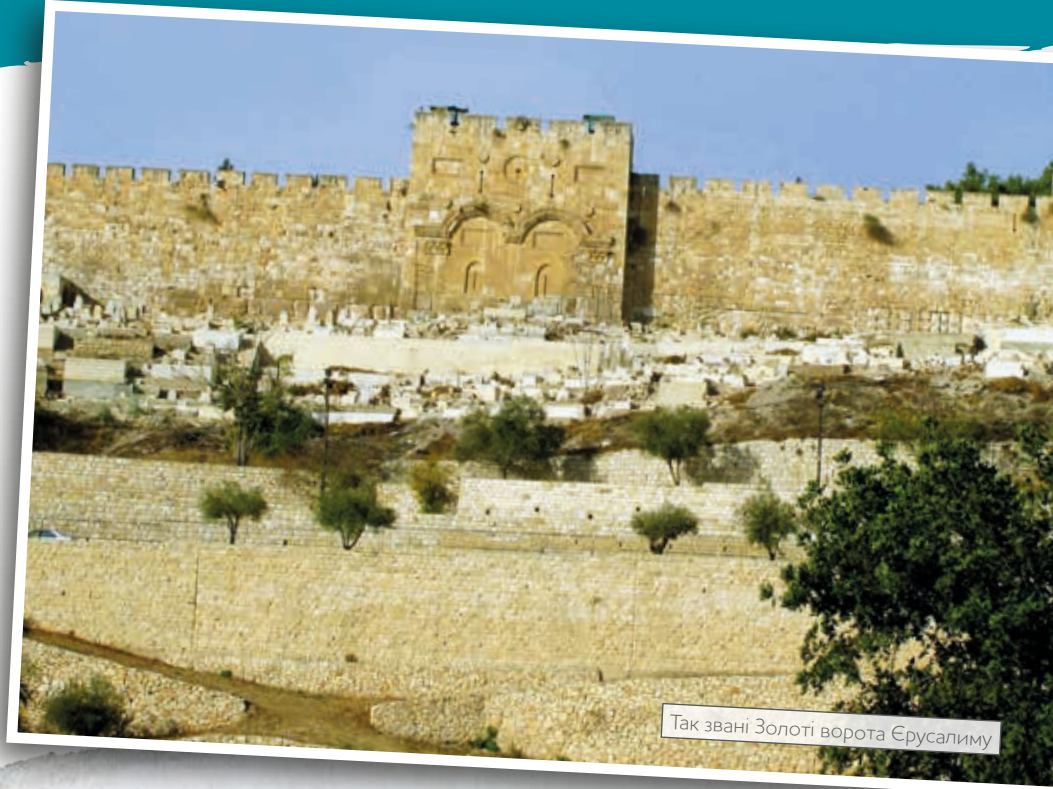
Так звані Золоті ворота Єрусалиму

Місто вирує. На всіх вулицях Єрусалиму люди перешіптуються і діляться новинами.