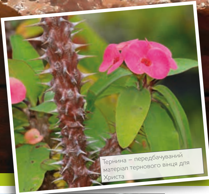
Тернина – передбачуваний матеріал тернового вінця для Христа

Прокуратор Юдейської провінції Пилат під час перехресного допиту закликає Ісуса відповісти: «Так Ти Цар?»