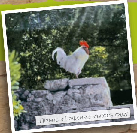
Півень в Гефсиманському саду