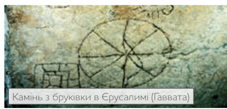
Камінь з бруківки в Єрусалимі (Гаввата)

Ісус відповів: «Сам ти кажеш, що Цар Я. Я на те народився, і на те прийшов у світ, щоб засвідчити правду. І кожен, хто з правди, той чує Мій голос» (Івана 18.37).