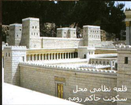
قلعه نظامی محل سکونت حاکم رومی

بعد از اینکه پیلاتس عیسی را در برابر مردم نگاه داشت؛ او را به جوخه اعدام سپرد و بعد نیز نوبت به تمسخر و استهزاء رسید. تاجی از خار بر سر او گذاشته شد. خارهای بلند و تیز جسم او را زخم آلود نموده بودند. چند بار به سختی چوب خورد، بنابراین در خون خود غلطیده بود. به همین جهت قادر نبود که در برابر شکنجه گران خود بایستد. با تمسخر و خنده خرقة ای ارغوانی رنگ را بر شانه هایش انداختند تا نشان پادشاهی او باشد. همه این کارها را با بدبینی و دشمنی به انجام می رساندند. با تمسخر در برابر او زانو می زدند و می گفتند: " درود بر پادشاه یهود." در راه منتهی به محل اعدام،