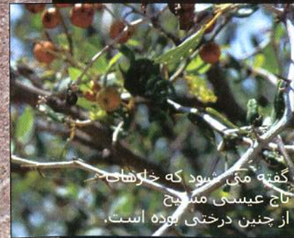
گفته می شود که خارهای تاج عیسی مسیح از چنین درختی بوده است.