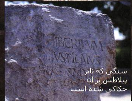
سنگی که نام پیلاتس بر آن حکاکی شده است

عیسی جواب داد: " تو می گویی که من پادشاه هستم. از این جهت من متولد شدم و به جهت این در جهان آمدم تا به راستی شهادت دهم، و هر که از راستی است سخن مرا می شنود ( یوحنا ۱۸: ۳۷)."