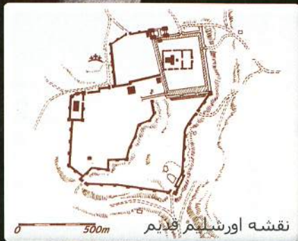
نقشه اورشلیم قدیم

پیلاتس حاکم استان یهودیه کسی که عیسی را مصلوب نمود و از او پرسید: " آیا تو پادشاه یهود هستی؟"