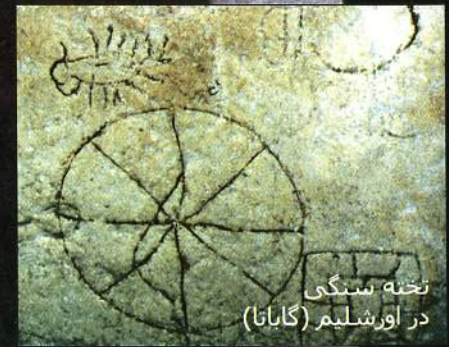
نخته سنگی در اورشلیم (گاباتا)